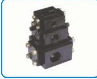
HAT TİPİ PİLOT UYARILI ÇEKVALFLER