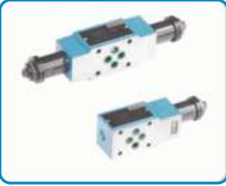
BASINÇ EMNİYET VALFLERİ