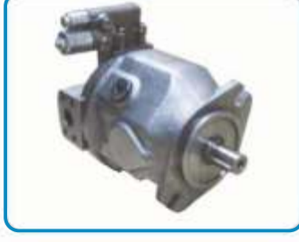
DEĞİŞKEN DEBİLİ PİSTONLU POMPALAR