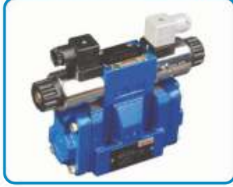
NG16 YÖN KONTROL VALFLERİ