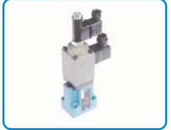
ORANSAL HASSAS HIZ AYAR VALFLERİ