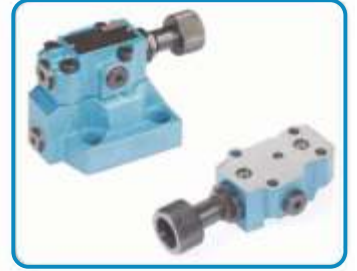
PLEYT TİPİ BASINÇ EMNİYET VALFLERİ