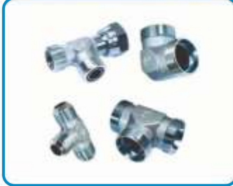
HİDROLİK REKOR ÇEŞİTLERİ