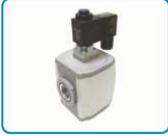
ELEKTRİK KONTROLLÜ AÇMA-KAPAMA VALFLERİ