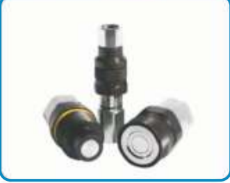
DÜZ ALIN HIZLI BAĞLANTI ELEMANLARI