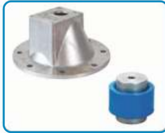
KAPLİN VE KAMPANALAR