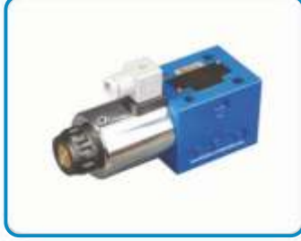
NG6 TEK BOBİN VALFLER