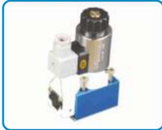
POPET TİP YÖN KONTROL VALFERİ