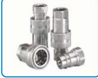
POPET TİP HIZLI BAĞLANTI ELEMANLARI