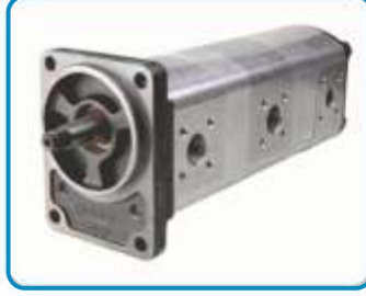
TANDEM DİŞLİ POMPALAR