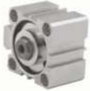
KISA STROK SİLİNDİRLER