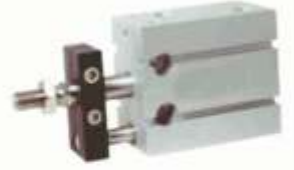
TABLALI ÇOKLU MONTAJ SİLİNDİRLERİ