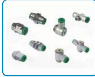
PNÖMATİK BAĞLANTI ELEMANLARI