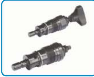
KATRIÇ TİP BASINÇ EMNİYET VALFLERİ