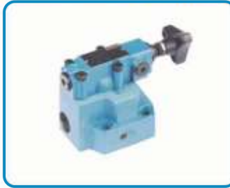
AKÜ DOLDURMA VALFLERİ