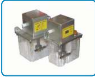
SIVI YAĞLAMA POMPALARI