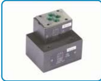
ARA PLAKA ÇEKVALFLER