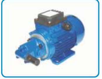
AĞIR HİZMET POMPALARI