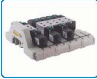
GRUPLANABİLİR PLEYT VALFLER