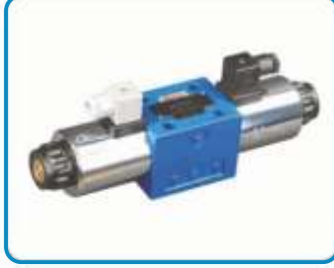
NG6 ÇİFT BOBİN VALFLER