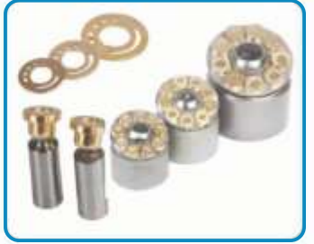
PİSTONLU POMPA TAMİR TAKIMLARI