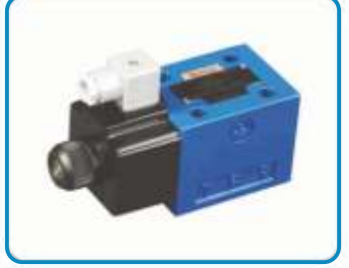
NG10 TEK BOBİN VALFLER