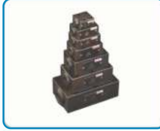
PLAYT TİP ÇEKVALFLER