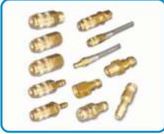
QUICK KAPLIN ÇEŞİTLERİ