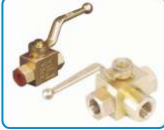
HİDROLİK KÜRESEL VANALAR