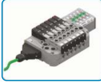
SCART GİRİŞLİ VALFLER