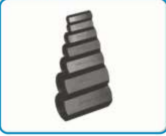
HAT TİPİ ÇEKVALFLER