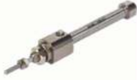
MİNİ KALEM SİLİNDİRLER