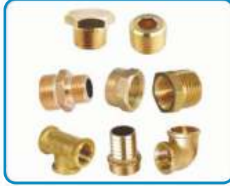
PİRİNÇ BAĞLANTI ELEMANLARI