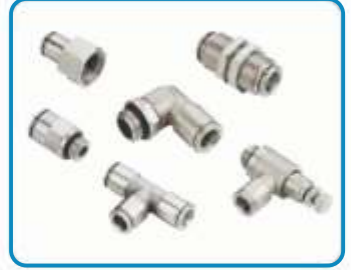
METAL BAĞLANTI ELEMANLARI