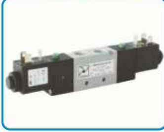
ÇİFT BOBİN VALFLER