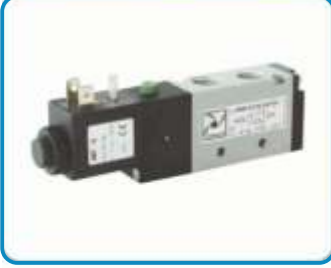
TEK BOBİN VALFLER