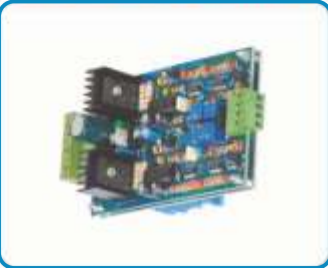
ORANSAL VALF KARTLARI