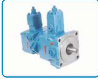
DEĞİŞKEN DEBİLİ TANDEM PALETLİ POMPALAR