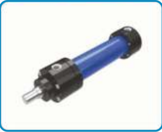
HİDROLİK SİLİNDİR ÇEŞİTLERİ