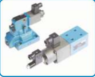
ORANSAL BASINÇ EMNİYET VALFLERİ