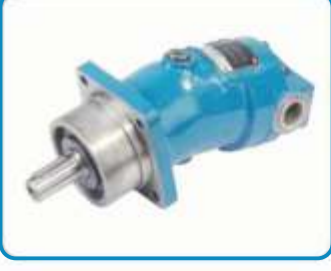
SABİT DEBİLİ PİSTONLU POMPALAR