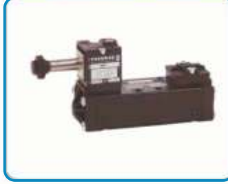
TEK BOBİN İSO VALFLER