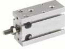
ÇOKLU MONTAJ SİLİNDİRLERİ