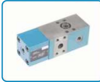
YÜK TUTMA VALFLERİ