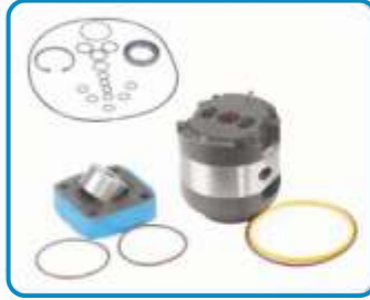
PALETLİ POMPA TAMİR TAKIMLARI