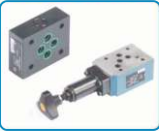
BASINÇ DÜŞÜRÜCÜ VALFLER