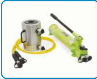
BULON ÇEKME KRIKO SİSTEMLERİ