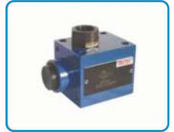
MANOMETRE KORUMA VALFLERİ