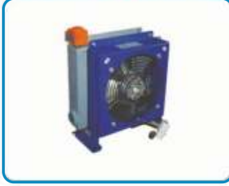
HİDROLİK FANLI SOĞUTUCULAR