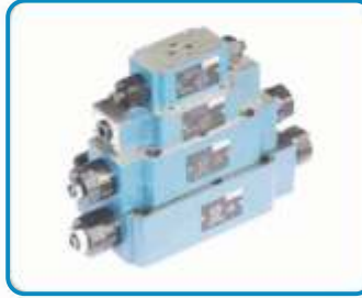
ARA PLAKA TİP HIZ AYAR VALFLERİ