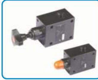
DİREKT UYARILI BASINÇ EMNİYET VALFLERİ