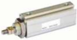
PLAYT TİPİ SİLİNDİRLER