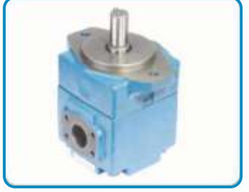
V SERİSİ PALETLİ POMPALAR