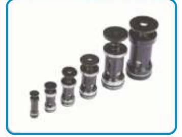
KATRIÇ TİP ÇEKVALFLER