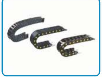
KABLO TAŞIMA KANALLARI