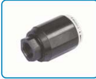
BORU TİPİ HIZ AYAR VALFLERİ