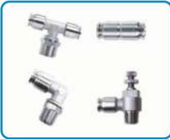
PASLANMAZ BAĞLANTI ELEMANLARI