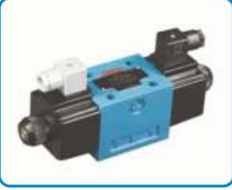
NG10 ÇİFT BOBİN VALFLER