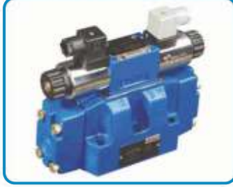
NG25 YÖN KONTROL VALFLERİ