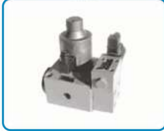
ORANSAL BASINÇ VE DEBİ KONTROL VALFLERİ