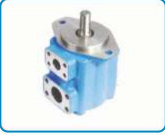
PV SERİSİ PALETLİ POMPALAR