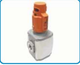
EL KONTROLLÜ AÇMA-KAPAMA VALFLERİ