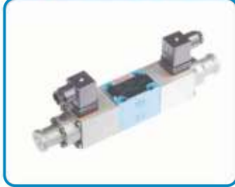
ORANSAL BASINÇ DÜŞÜRÜCÜ