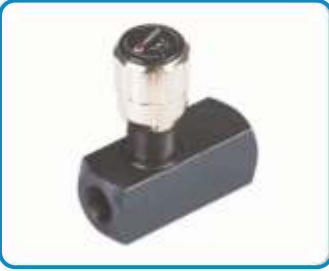
HAT TİPİ HIZ AYAR VALFLERİ