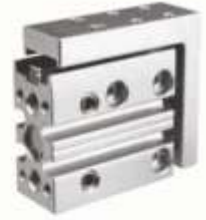
YATAKLI SLAYT SİLİNDİRLER