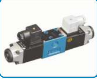
NG5 YÖN KONTROL VALFLERİ