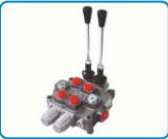
HİDROLİK KUMANDA KOLLARI