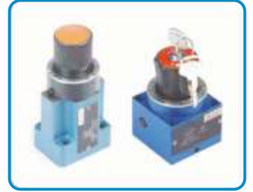
HASSAS HIZ AYAR VALFLERİ