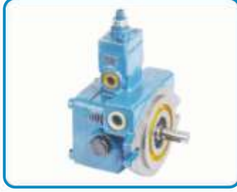
DEĞİŞKEN DEBİLİ PALETLİ POMPALAR